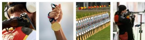
Bogensport – Trainingsmöglichkeiten in der Praxis für den Breitensport